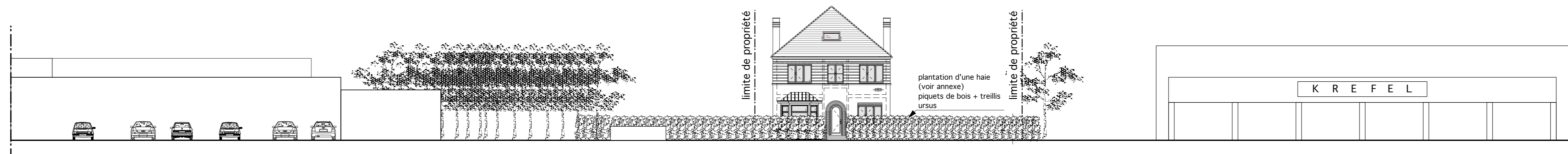
ÉLEVATION EST échelle : 1/200ème