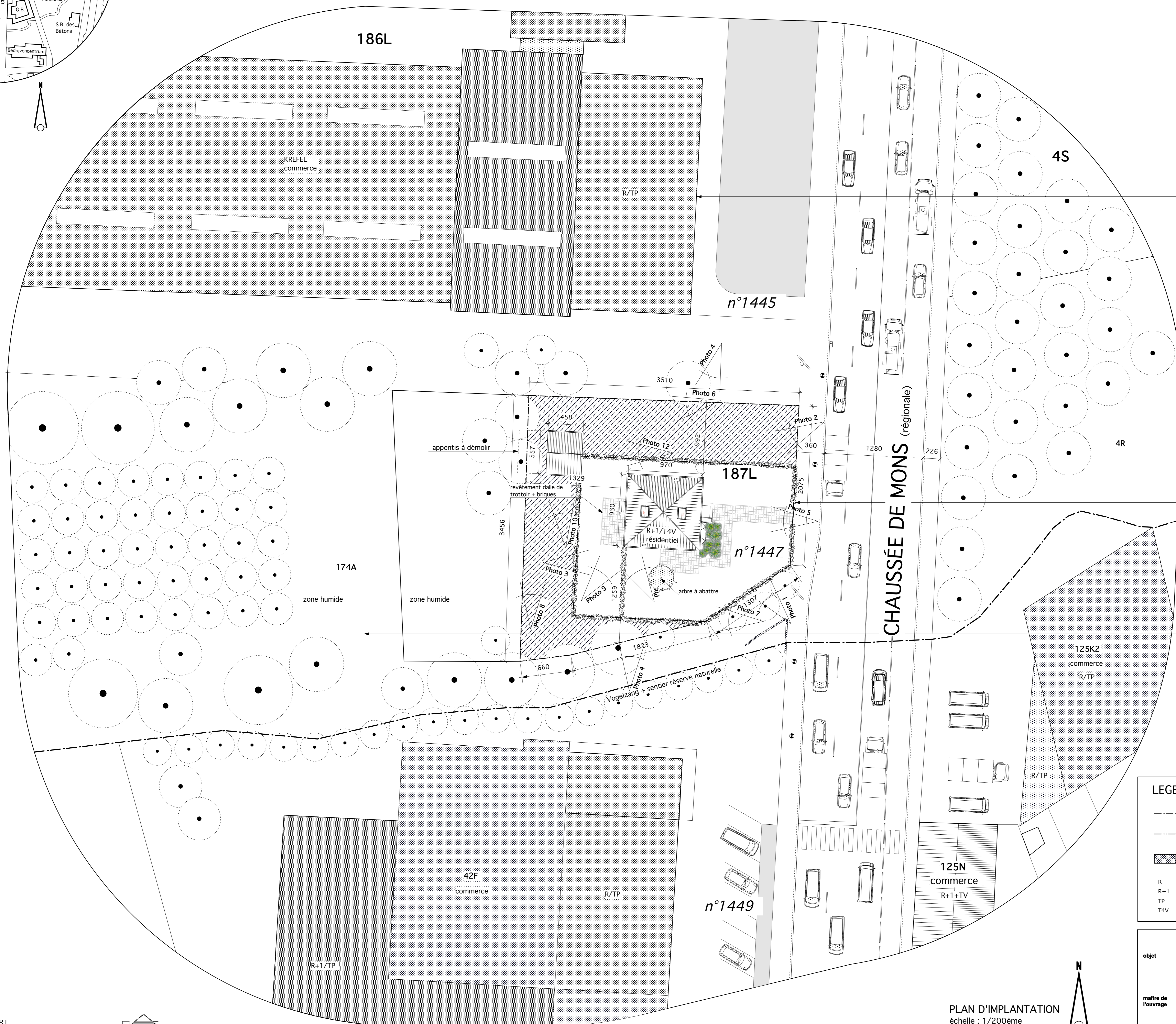
PLAN D'IMPLANTATION échelle : 1/200ème

Parcelle: E 186 L SOCIÉTÉ ANCIENS ÉTABLISSEMENTS BERG Chée de Waterloo, 538 1050 Bruxelles (Ixelles)